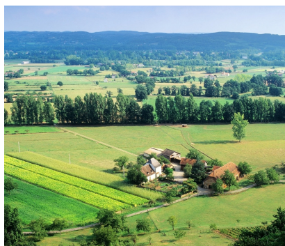
Préservation du foncier agricole