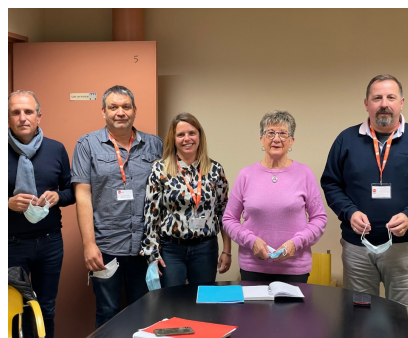
Salariés du secteur médico-social "les oubliés du Ségur"

Le 3 novembre nous avons débattu au Sénat de la proposition de loi destinée à lutter contre l'accaparement excessif des terres face aux appétits des sociétés d'investissement. Un texte qui manque d'ambition pour renforcer