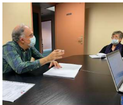
Rencontre avec la CIMADE