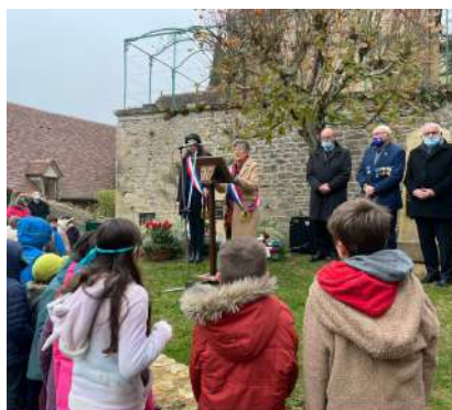
Inauguration stèle commémorative - Plazac