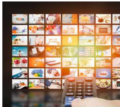
Soutien au secteur de l'hôtellerie - restauration

Avec mon collègue Serge Mérillou, nous demandons une nouvelle fois au Ministre de l'Agriculture de publier ce décret d'application sans attendre la date butoir de 2022.