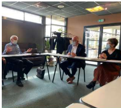
Revalorisation des retraites agricoles

La DETR 2021 est stable et les crédits délégués en 2021 pour la Dordogne s'élèvent à 14 925 546 euros, soit un montant en augmentation de 3%. Le nombre de dossiers déposés est de 418 contre 292 en 2020.