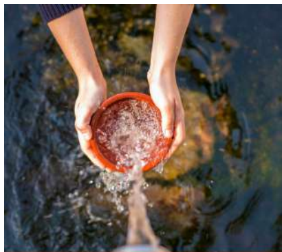
PPL EAU - Bien commun de l'humanité