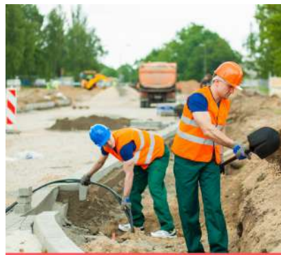
Dotation d'équipements des territoires ruraux