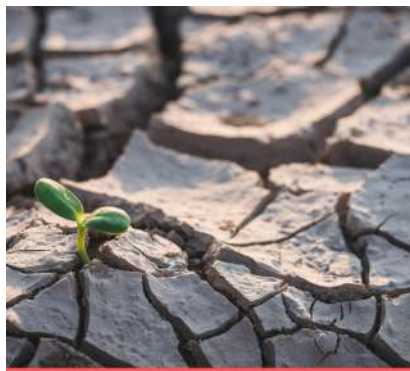
Reconnaissance de l'état de catastrophe naturelle